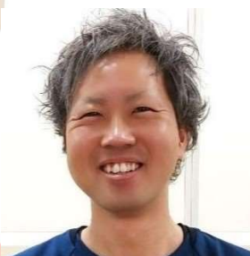
骨と筋肉の専門家